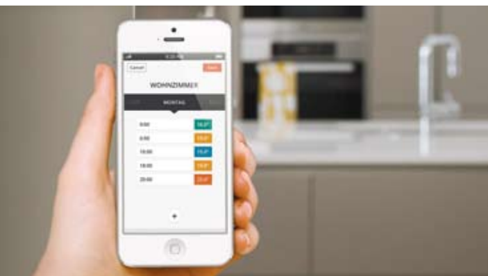
Eine Heizungs-App kontrolliert die Temperatur je nach Raum und Tageszeit.

Gradgenau. Mit einer funkgesteuerten Heizungsregelung lässt sich die Steuerung automatisieren. Passend zum Tagesablauf der Bewohner korrigiert sie die Temperatur nach oben oder unten – damit pünktlich zum Aufstehen das Badezimmer