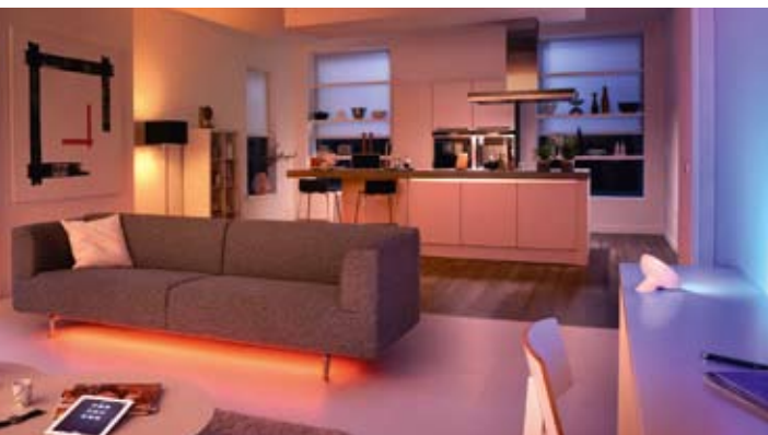
LED-Lampen mit farbiger RGB-Technik tauchen den Raum in magisches Licht.

Lichtqualität. Anders als Kompaktleuchtstofflampen können die meisten vernetzten Leuchtmittel ihre Farbtempera-